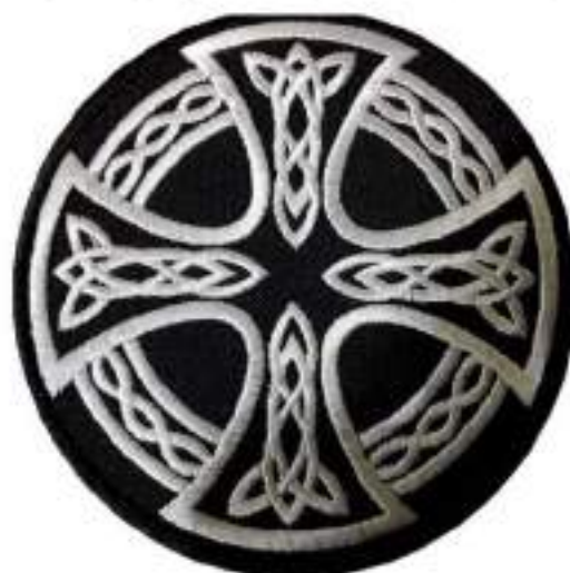
Рисунок 2. Кельтский крест. Символ многих расистских организаций