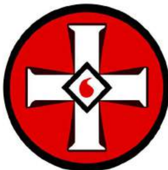
Рисунок 1. Эмблема ультраправой организации «Ку-клукс-клан».